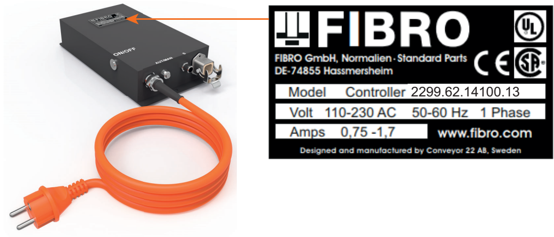
Abb. 3-3 Typenschild

Auf der Steuereinheit ist ein Typenschild angebracht. Zu allen Fragen und Bestellungen müssen die Angaben auf dem Typenschild mitgeteilt werden.