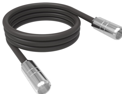
Fig. 3-4 Cavo di collegamento

Il cavo di collegamento collega la centralina di controllo con il convogliatore elettrico.