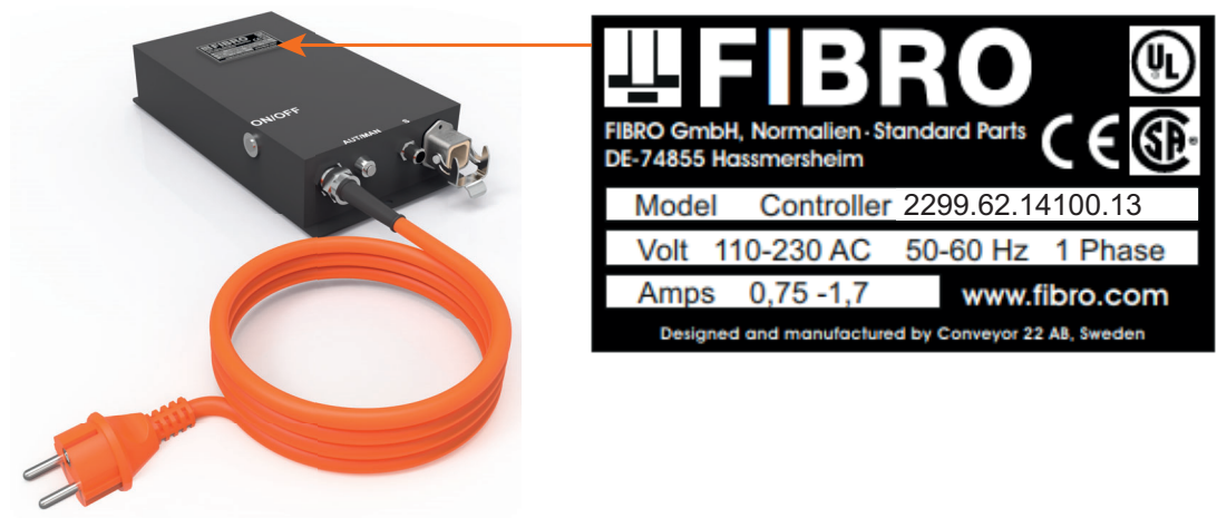
Fig. 3-3 Targhetta del tipo

Sulla centralina di controllo è applicata una targhetta identificativa. Per tutte le domande e gli ordini è necessario indicare le informazioni sulla targhetta.