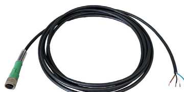
Fig. 3-5 Cavo di segnale

Il cavo di segnale collega la centralina di controllo con un meccanismo esterno.