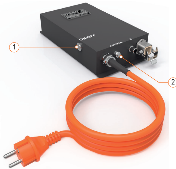
Fig. 6-1 Elementi di comando centralina di controllo BLACK LINE EX