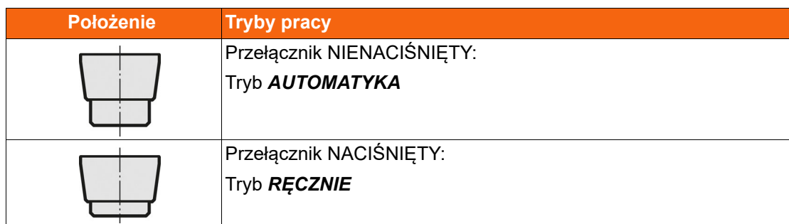
Tab. 6-1 Wybór trybu pracy

Ustawić tryb pracy przelącznikami AUTOMATYKA / RĘCZNIK.