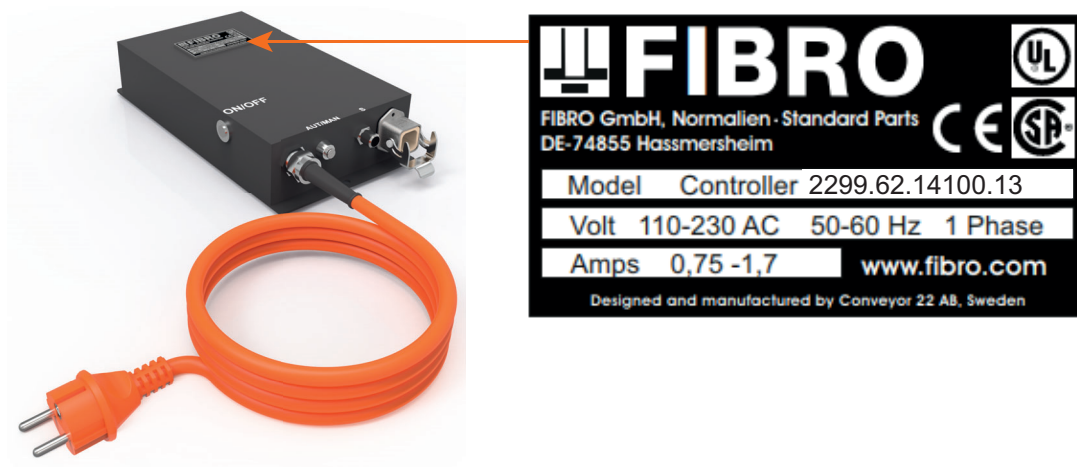
Rys. 3-3 Tabliczka znamionowa

Na jednostce sterującej umieszczona jest tabliczka znamionowa. W przypadku jakichkolwiek pytań i zamówień należy podać dane znajdujące się na tabliczce znamionowej.