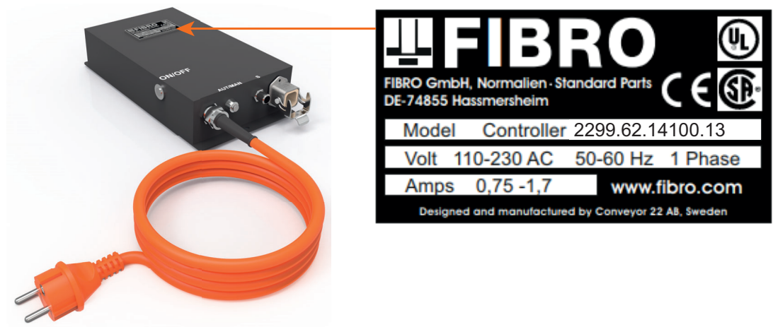
Fig. 3-3 Placa de características

En la unidad de control está colocada una placa de características. Para realizar cualquier consulta o pedido, debe indicarse la información que aparece en la placa de características.